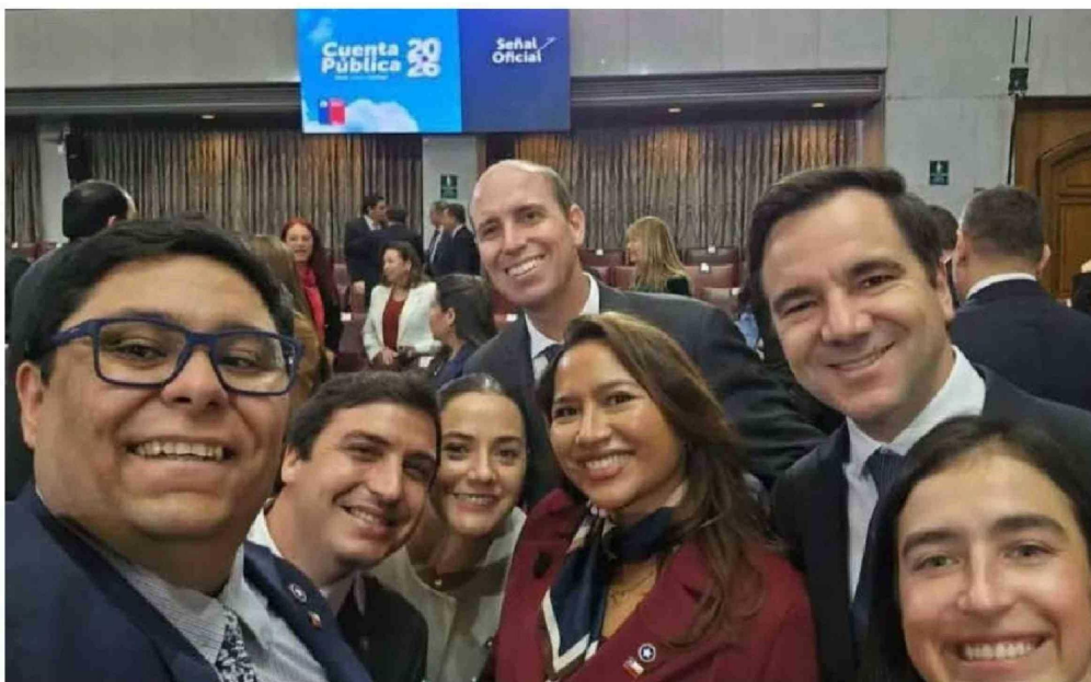
► El ministro de Seguridad, Martín Arrau, junto a parlamentarios republicanos.

Minutos antes de que el Presidente Kast ingresara al recinto, Arrau fue visto conversando durante varios minutos con Eduardo Frei Ruiz-Tagle, el único expre-