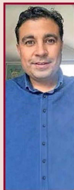
Gianni Rivera, vicepresidente DC.