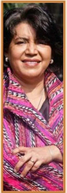
Yasna Provoste, senadora.