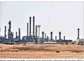
Hasta ayer por la tarde, el precio de los principales referentes del petróleo (WTI y Brent) había caído a sus menores niveles en casi un mes.

El anuncio llega tras casi mes y medio de un conflicto que redefinió las expectativas sobre crecimiento, inflación y riesgo geopolítico en to-