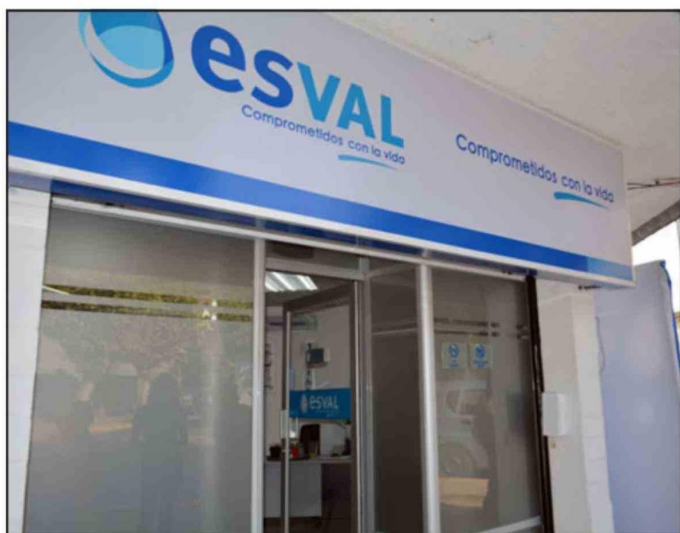
El formulario de postulación se puede solicitar en cualquier sucursal de Esvál.

• En estos casos, debes notificar a la municipalidad para gestionar un nuevo beneficio.