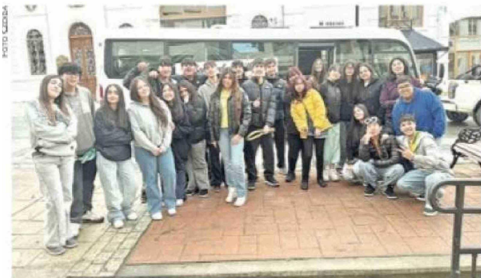
En el Kiosco Roca celebraron los alumnos del cuarto medio Philippi su último Día del Estudiante en el Colegio Punta Arenas.

La celebración incluyó, además, presentaciones preparadas por funcionarios del establecimiento, quienes participaron activamente en las actividades dirigidas a los estudiantes. Las dinámicas se desarrollaron en distintos espacios del liceo y estuvieron enfocadas en generar instancias de participación y convivencia entre los cursos. LPA