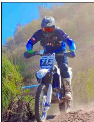
Más de 300 pilotos compiten en distintas categorías, incluyendo infantiles, damas y adultos.

Para más información e inscripciones, puede visitar la cuenta de Instagram: @jahuelmotoclub .