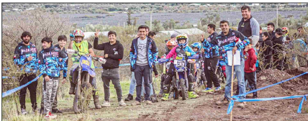
El evento se ha llevado a cabo por más de diez años, consolidándose como una tradición deportiva en la zona.

ORACIÓN A SAN JUDAS TADEO.- Patrón de los casos difíciles, ¡oh, gloriosísimo Apóstol San Judas Tadeo! Siervo fiel y amigo de Jesús, con el nombre del traidor que entregó a nuestro querido Maestro en manos de sus enemigos; ésta ha sido la causa de que muchos os hayan olvidado, pero la Iglesia os honra e invoca universalmente como patrón de los casos difíciles y desesperados. Rogad por mí, que soy tan miserable y haced uso, os ruego, de ese privilegio especial a vos concedido de socorrer visible y prontamente cuando casi se ha perdido toda esperanza. Venid en mi ayuda en esta gran necesidad para que reciba los consuelos y socorros del cielo en todas mis necesidades, tribulaciones y sufrimientos, particularmente (haga aquí la súplica que desee obtener, con fe y devoción, y repita esta oración durante 9 días, prometiendo publicarla en el 8º día y por difícil e imposible, se le concederá). Y para que bendiga a Dios con vos y con todos los escogidos por toda la eternidad. Amén