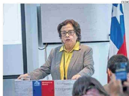
LA MINISTRA DE MINERÍA VISITÓ LA REGIÓN DE ANTOFAGASTA.

minación de incorporar los acuerdos alcanzados en estos diálogos directamente en los contratos especiales de operación de litio. “No solo cumplimos con lo que establece el Convenio 169 de la OIT, sino que los compromisos asumidos con las comunidades se traducen en los contratos, como ya lo hicimos con las consultas concluidas en la región de Atacama”, puntualizó.