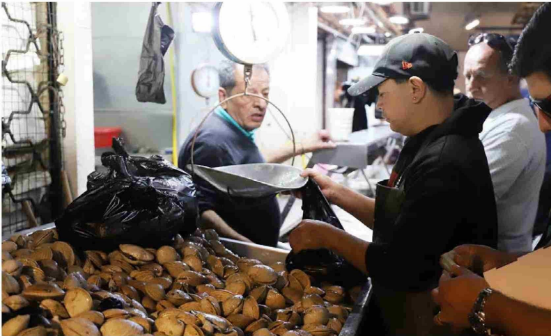
Las almejas y los choritos también fueron altamente buscados por parte de la clientela.