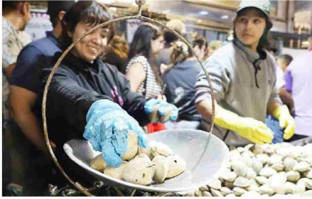
Distintas pescaderías tuvieron una gran demanda respecto a los frutos marinos más allá del pescado típico en Viernes Santo.

Título: Largas filas para comprar pescado en el mercado de Rancaqua