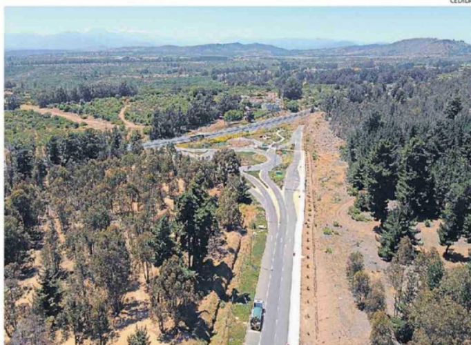
LA EJECUCIÓN TOTAL DEL PROYECTO SE PROYECTA COMO MÍNIMO, EN DOS AÑOS MÁS.

SOLICITARON UN AUMENTO DE PLAZOS Según información entregada por el MOP, el