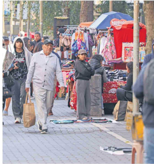
Una de las cifras más bajas habla de que encontrar trabajo en la región "es difícil".

Ulloa planteó que la región arrastra dificultades estructurales