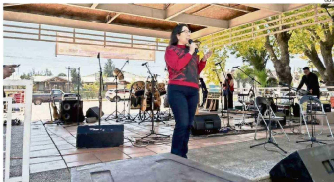
LA FERIA SE CONSOLIDÓ COMO UN ESPACIO DE ENCUENTRO COMUNITARIO Y APOYO AL EMPRENDIMIENTO.