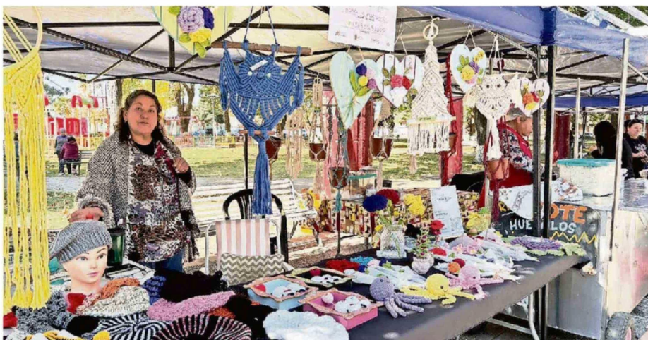
EMPRENDEDORES LOCALES EXHIBIERON PRODUCTOS TÍPICOS Y ARTESANÍAS DURANTE LA 2ª FERIA COSTUMBRISTA DE SAN IGNACIO.