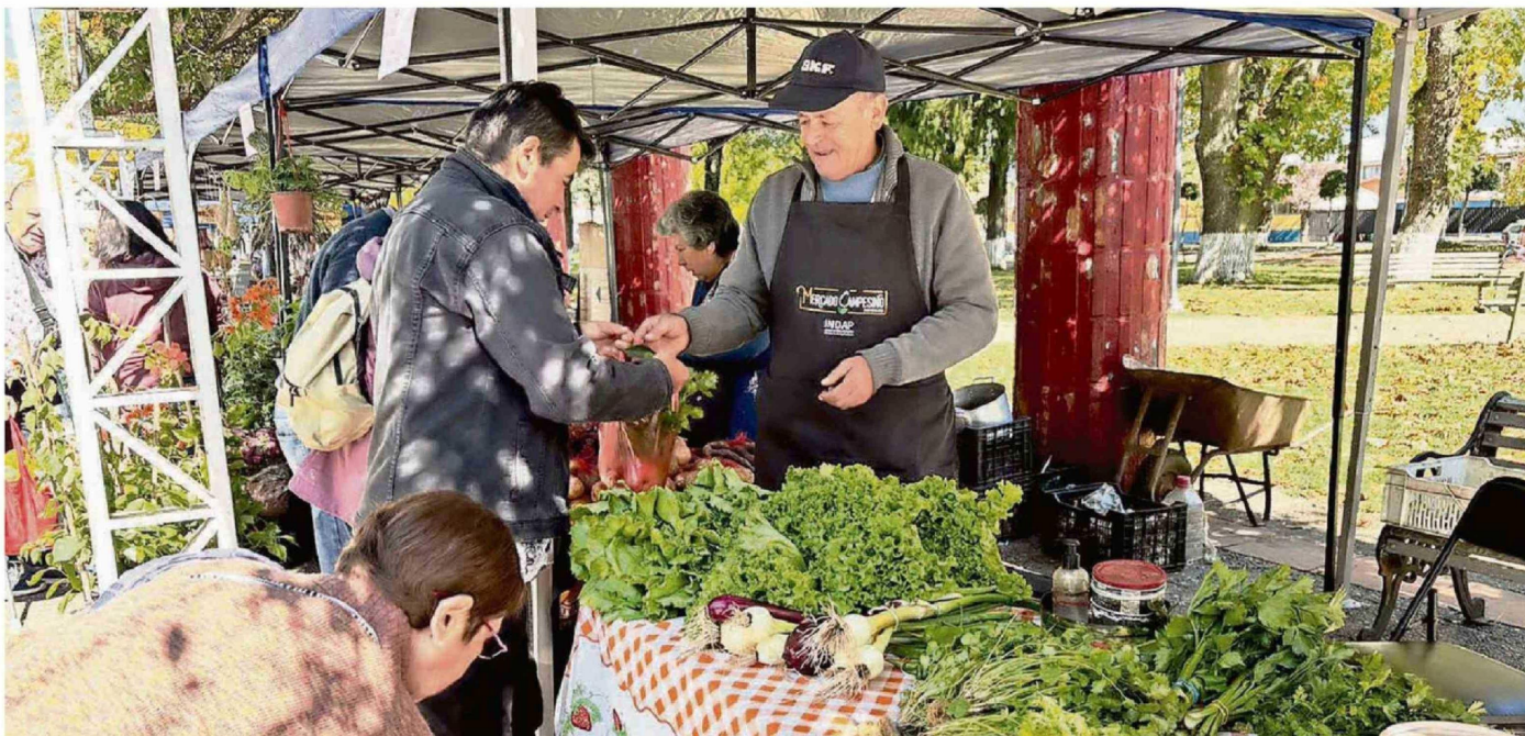
VECINOS Y VISITANTES RECORRIERON LOS STANDS EN UNA JORNADA MARCADA POR LA IDENTIDAD CAMPESINA.