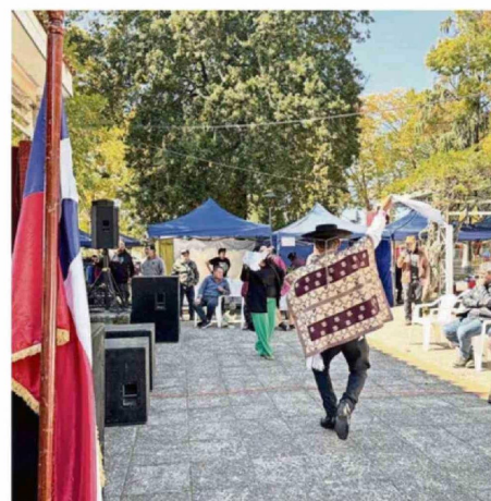
PRESENTACIONES FOLCLÓRICAS DIERON VIDA A LA ACTIVIDAD, RESALTANDO LAS TRADICIONES DE LA COMUNA.