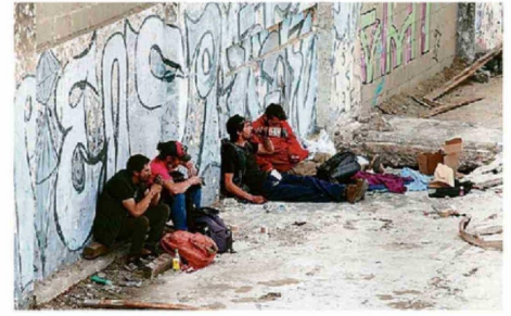
TERRENO EN AV. BRASIL, DONDE ANTES HABÍA UN SUPERMERCADO.

Frente a este escenario, desde la Municipalidad de