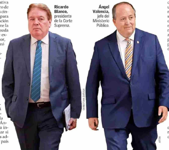
Ricardo Blanco, presidente de la Corte Suprema.

Algunos de esos grupos emitieron más de 71 mil documentos entre 2020 y 2022, con un perjuicio superior a los $26 mil millones.