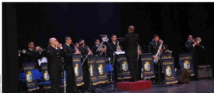
La Tercera Zona Naval abre en mayo una nutrida agenda de actividades abiertas a la comunidad.

La Tercera Zona Naval abre en mayo una nutrida agenda de actividades abiertas a la comunidad, reafirmando su compromiso con la consolidación de un Chile verdaderamente marítimo.