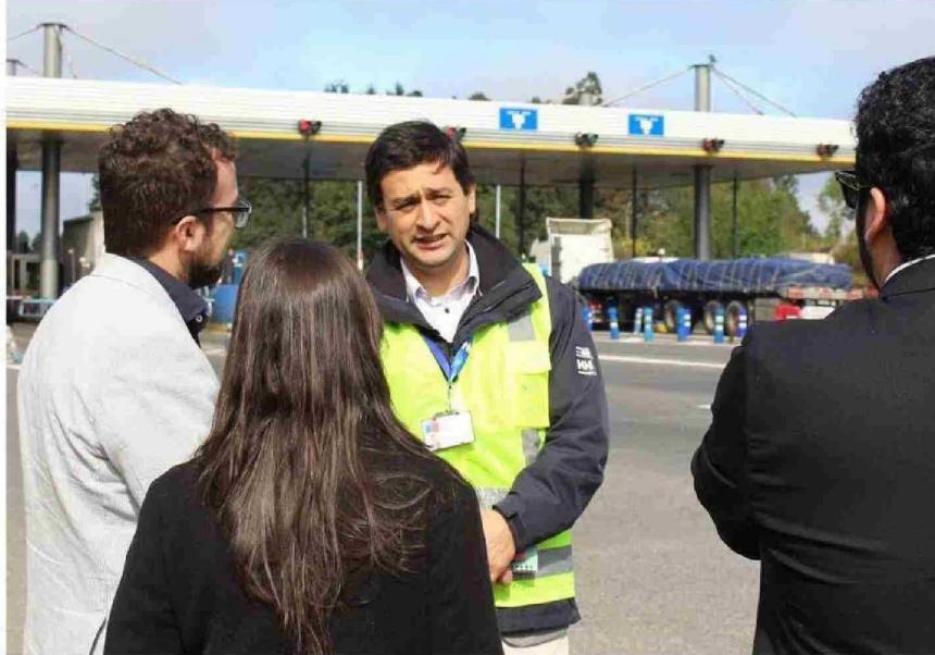
EL DIRECTOR REGIONAL TAMBIÉN COMPLETÓ UN MAGÍSTER EN GESTIÓN DE RECURSOS ACUÁTICOS EN LA UNIVERSIDAD CATÓLICA DE VALPARAÍSO.

Por otro lado, tenemos el área de atención de usuario que está en estas dos oficinas de Valdivia y Corral, pero si alguien llega a la dirección regional también se le atiende. Después está todo lo que tiene que