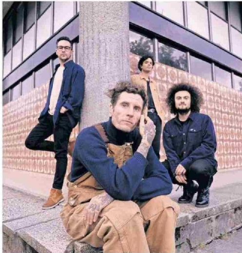
Niño Cohete está en proceso de armar una gira por varias ciudades del país.

ro, sus integrantes se enteraron de la desastrosa situación derivada en la zona a raíz de los incendios forestales.