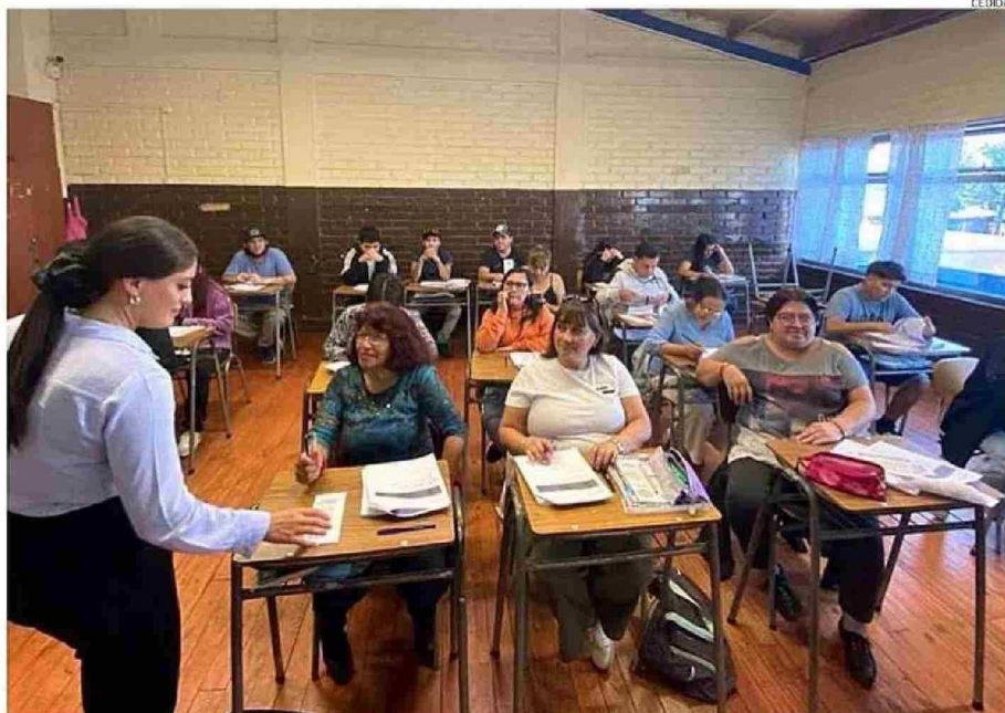
LAS AULAS DE LA EDUCACIÓN VESPERTINA DEL COLEGIO JUAN XXII EN RAHUE ALTO SON UNA MUESTRA DEL DESEO DE APRENDER Y NIVELAR ESTUDIOS.

REALIDAD. Según los resultados entregados por el Instituto Nacional de Estadísticas (INE), las cifras están consideradas para mayores de 18 años, donde el primer grupo nunca asistió a ningún nivel educacional, mientras que el segundo accedió a algún nivel entre 1° y 8° básico. La cifra evidencia que el acceso a la educación sigue teniendo diferencias en la población, según la mirada de profesores y personas que recién de adultos están nivelando sus estudios.