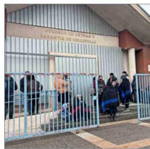
COLLIPULLI. — Hasta el tribunal llegaron familiares de los miembros de Temecucui.

En tanto, los otros dos casos fueron detenciones en flagrancia. Se trata de A.H.O.A. (hombre, 29), con causas por manejo en estado de ebriedad, porte de arma cortante y consumo de drogas, y de M.D.Q.H. (mujer, 41), con antecedentes por oponerse a la acción de la autoridad, usurpación de propiedad y maltrato de obra a carabineros.