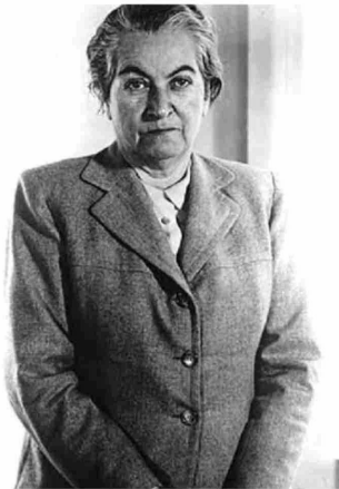
► La Premio Nobel Gabriela Mistral y el monumento a Manuel Baquedano.

En el Ejecutivo proyectan acuñar el espacio como el "Polo de los Monumentos". Esto ya que Baquedano y Mistral compartirán, a su vez, espacio con otras esculturas hoy ubica-