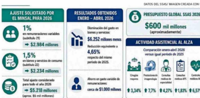
PARTE IMPORTANTE DEL AHORRO ACTUAL SE DEBE A UNA CONSIDERABLE REDUCCIÓN DEL AUSENTISMO LABORAL.