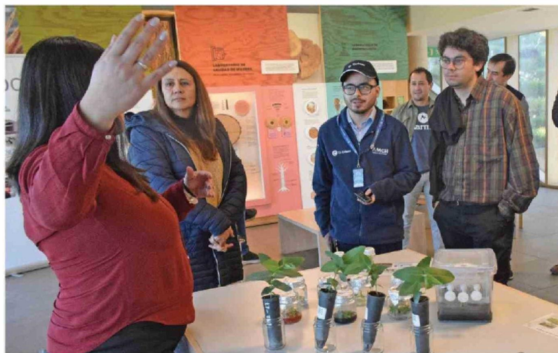
PROFESIONALES DEL CENTRO DE I+D de Los Ángeles explicaron parte de los procesos asociados a mejoramiento genético, micropropagación vegetal y análisis de materiales desarrollados en estas instalaciones.

Un recorrido por instalaciones ubicadas en Los Ángeles y Yumbel permitió conocer procesos vinculados a la selección de materiales genéticos, micropropagación, clonación vegetal y cultivo de plantas destinadas a programas forestales, etapas que anteceden al establecimiento y desarrollo de plantaciones en distintas zonas del país.