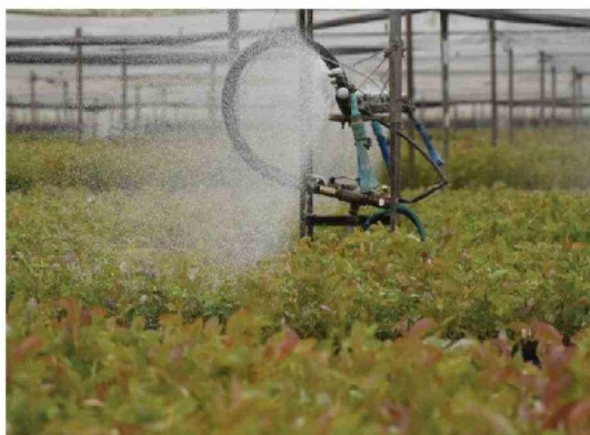
EL VIVERO CARLOS DOUGLAS, ubicado en Yumbel, concentra la producción de plantas destinadas a programas forestales y proyectos de restauración.