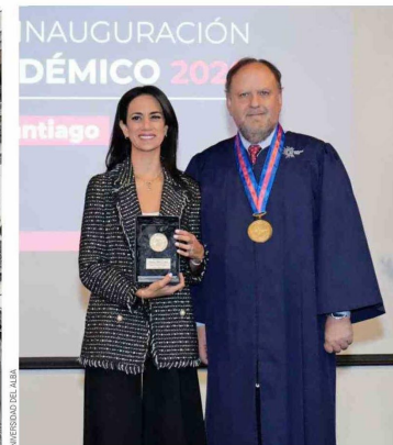
UNIVERSIDAD DEL ALBA