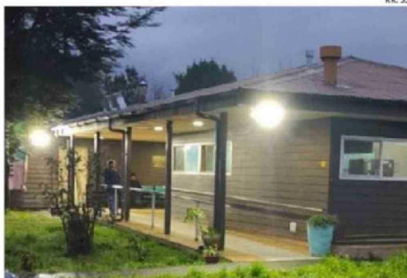
ALBERGUE DISPUESTO EN LA COMUNA DE QUELLÓN.

A ello se suman los dispositivos del Plan Calle, que operan por un periodo aproximado de 140 días durante el invierno.