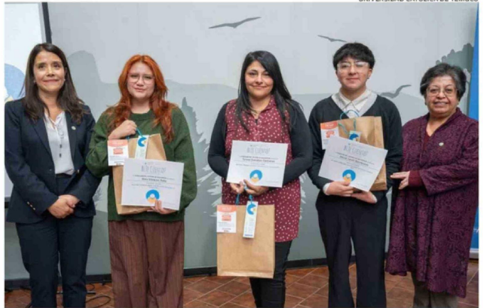
UNIVERSIDAD CATÓLICA DE TEMUCO