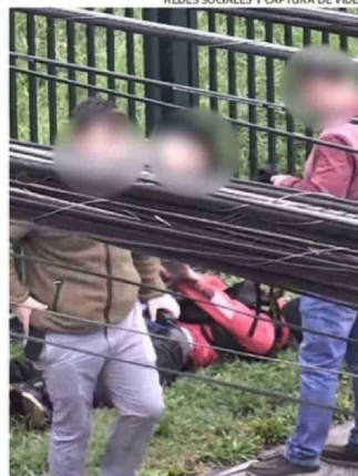
LOS ADOLESCENTES QUE INGRESARON AL LPN CON ARMAS FUERON DETENIDOS MIENTRAS ESCAPABAN.

apuntó el delegado deslizando una relación que podría tener nexos políticos.