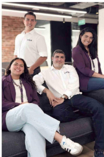
“De izquierda a derecha: