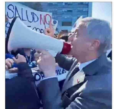
El Presidente José Antonio Kast usó un megáfono en Temuco para dialogar con manifestantes en el frente de un hospital, los que reclamaban contra eventuales rebajas presupuestarias en el sector de la salud.

• En Renovación Nacional advierten que la “pretensión de gobernar todo desde el Segundo Piso ya la hemos conocido en gobiernos anteriores y no resulta bien”. • A privados les preocupa que las diferencias entre legisladores y asesores impacten en el trámite de la “ley miscelánea” y en el “ambiente para la recuperación económica”.