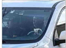
La víctima fue encontrada en Colina, después de que la policía recibiera una llamada anónima que alertaba del incendio de un vehículo abandonado.

Hay cuatro arrestados: Antiguos cabecillas del Tren de Aragua y al menos tres casas de cautiverio, en el centro de pesquisas por secuestro de empresario ferretero