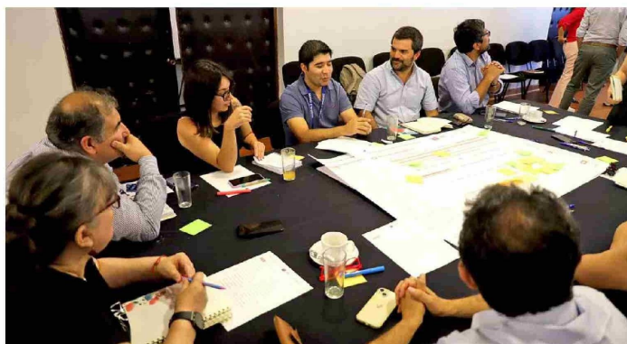
Inicialmente se integrarán cuatro comunas de la región, pero se espera sumar otras gradualmente.

da una escala que permite generar un bienestar y una contribución al territorio donde se emplaza". Asimismo, la administradora enfatizó que "si la descentralización no hubiese sido un tema de discusión en estos últimos años, es bastante poco probable que hubiésemos alcanzado a obtener un área metropolitana. El área metropolitana no es una simple resolución, contra una razón, no es una simple publicación en el Diario Oficial. Aquí hay años de trabajo de parte de los equipos técnicos, tanto del gobierno regional como de distintos municipios".