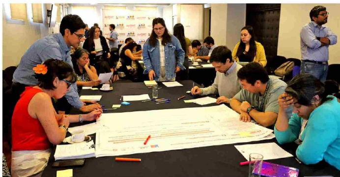
Equipos técnicos trabajaron en conjunto para la gestión del futuro Área Metropolitana de O'Higgins.