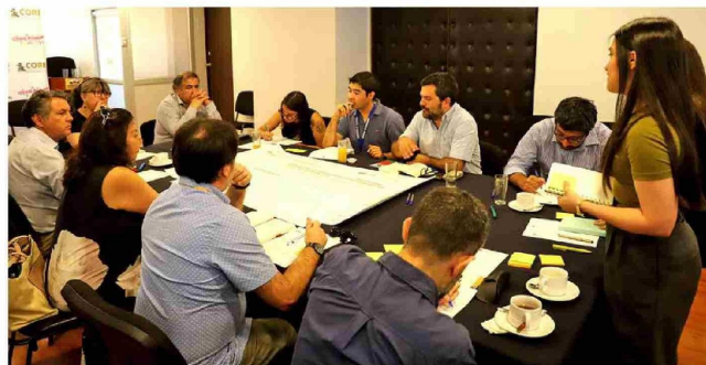
Desde el 2017 se estuvo realizando el diagnóstico de un proyecto que está más cerca que nunca de volverse real.

primeras cuatro comunas que contemplará, "en ningún caso quiere decir que van a ser las únicas cuatro [...]. Tenemos un horizonte de crecimiento de manera escalonada que pueda permitir, ir con el tiempo, incorporando otras comunas". Además, puntualizó que estas fueron escogidas porque "acceder a la conformación de un Área Metropolitana implicó cumplir con una serie normativa de un decreto presidencial que estipula, digamos, cuáles son los requerimientos para poder conformar esta área. Dentro de la propuesta que hizo la región de O'Higgins, particularmente desde el Gobierno Regional y trabajo conjunto con los municipios, logramos