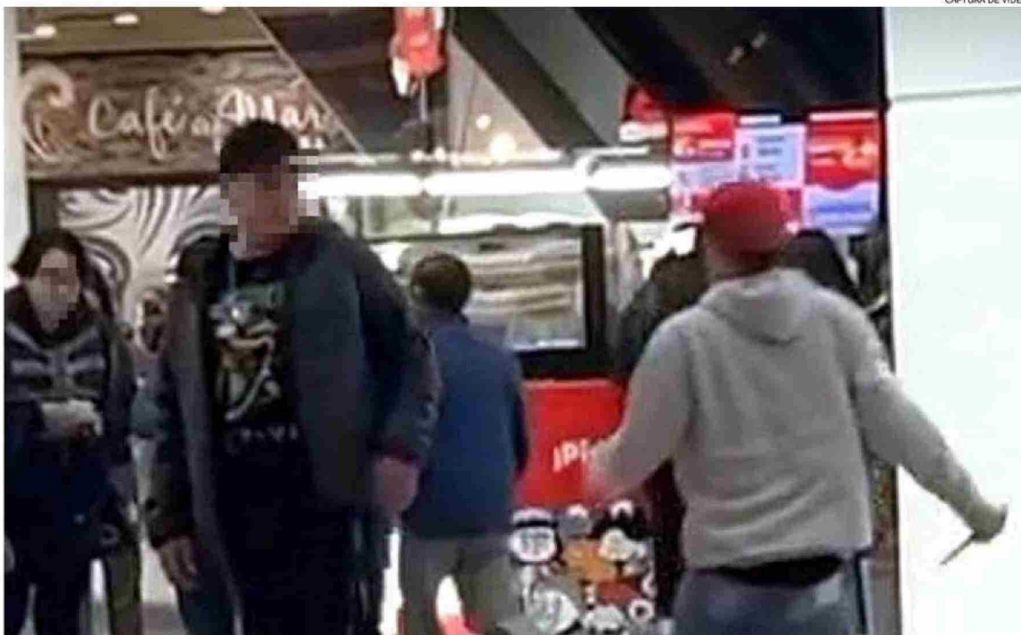
LA PRIMERA QUINCENA DE ABRIL FUE APUÑALADO UN JOVEN EN EL TERCER PISO DEL MALL PASEO COSTANERA. EL PASADO MARTES, EL VICTIMARIO FUE ACUCHILLADO AFUERA DEL MALL.