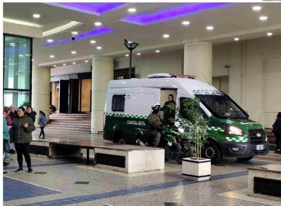
CARABINEROS DE LA SEGUNDA COMISARÍA DISPUSO DE UN PLAN ESPECIAL EN ESTE LUGAR, PARA PREVENIR ACTOS DELICTIVOS.

El Grupo Pasmari, propietario del Centro Comercial, en una declaración pública plan-