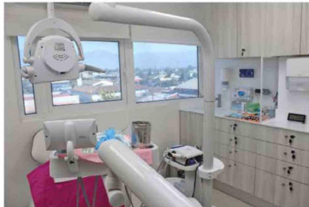
Las modernas dependencias de Ecolook Dental, espacio orientado a la prevención y tratamiento de la salud oral en mujeres embarazadas.