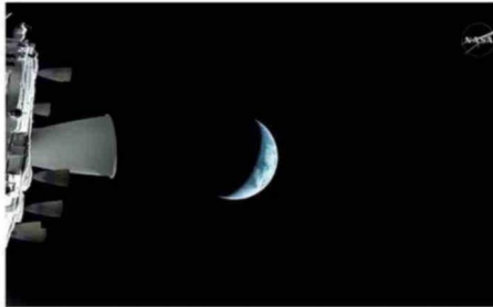
IMAGEN DISTRIBUIDA POR LA NASA QUE MUESTRA LA NAVE ORIÓN DE LA MISIÓN ARTEMIS II EN SU TRAYECTORIA DE ALEJAMIENTO DE LA TIERRA.

Las dos imágenes, que ofrecen una vista de la Tierra, estaban acompañadas por un mensaje de la NASA que subraya que las fotografías son «un recordatorio de que, sin importar cuán lejos lleguemos, seguimos siendo un solo mundo: observando, manteniendo la esperanza y aspirando a llegar más alto».