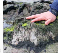
Un tocón de alerce tal como se ve actualmente.

El lugar se encuentra en un estado de conservación delicado, ya que no solo tiene que soportar el paso de las olas y las mareas, sino que también la destrucción del hombre, que incluso pasa con vehículos al lugar, cuenta la