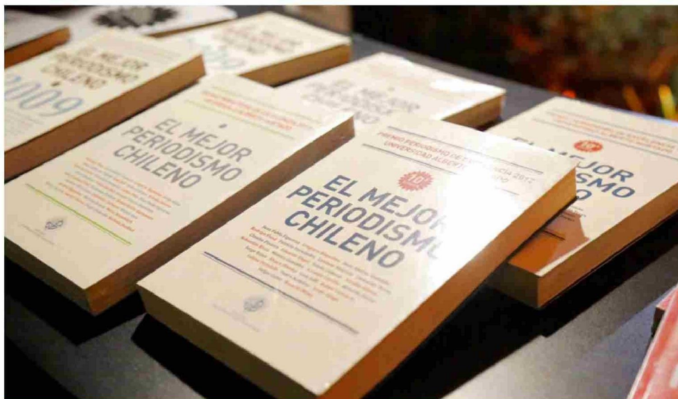
Premio Periodismo de Excelencia, entregado por la Universidad Alberto Hurtado desde 2003

como promover la generación de redes regionales y nacionales, destinadas a transferir conocimiento desde la academia hacia las políticas públicas del país. Asimismo, se requiere la creación de nuevos fondos concursables de investigación que permitan valorar el quehacer e impacto de las disciplinas humanistas, artísticas y sociales.