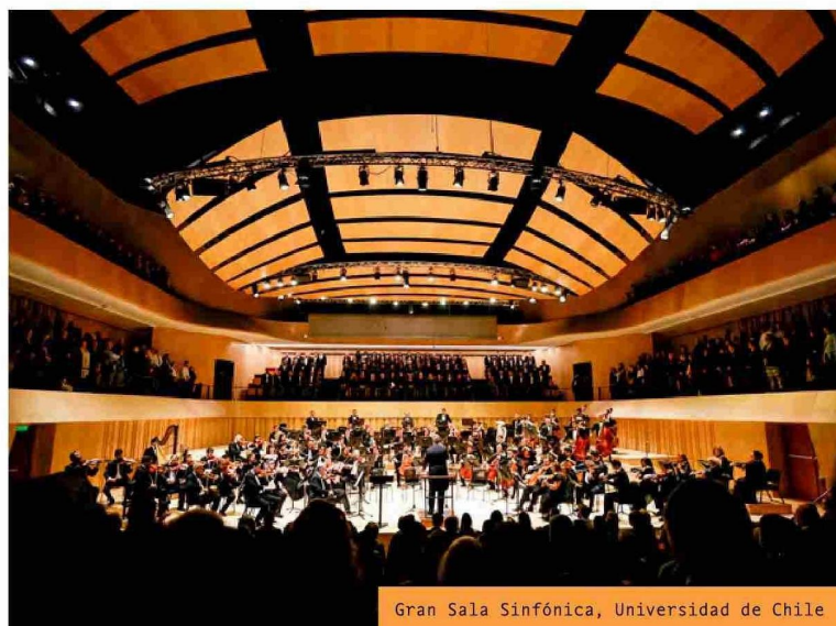
Gran Sala Sinfónica, Universidad de Chile

Las universidades católicas han de ser lugares inclusivos donde se aprende a razonar con rigor, a obrar con rectitud y a servir mejor a la sociedad. La universidad debe promover el diálogo entre fe y razón, de modo que ambas se encuentren en la verdad al servicio de la persona.