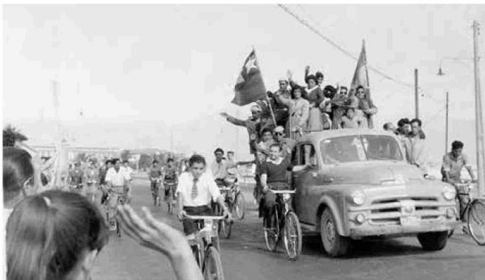
Momento histórico con la llegada de los camiones desde Oruro al puerto de Iquique.