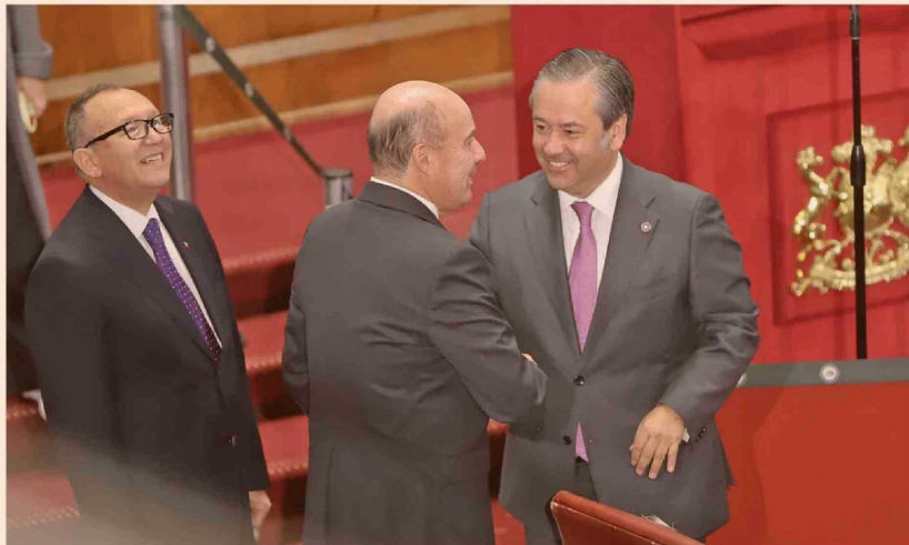
Los ministros de la Segpres, José García Ruminot, y de Hacienda, Jorge Quiroz, dialogan con el presidente de la comisión de Hacienda de la Cámara de Diputados, Agustín Romero.

Agregó que, además, convocará a una comisión de expertos con el mandato de proponer una nueva arquitectura del Estado. "Una es-