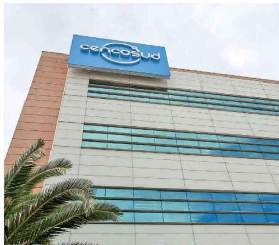
Acción de Cencosud

"La acción puede continuar presionada un tiempo. Es una historia