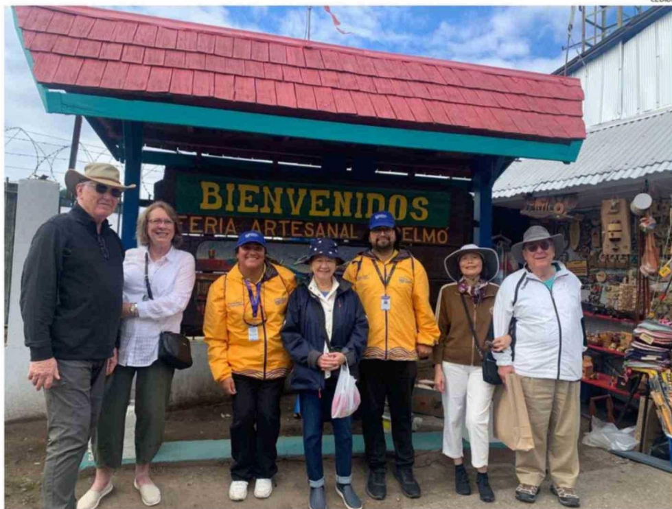
EN EL SECTOR DE ANGELMÓ, LOS MONITORES DE SEGURIDAD ENTREGARON INFORMACIÓN EN INGLÉS A LOS VIAJEROS DE AMBOS CRUCEROS.

seguridad de los turistas y orientarlos en inglés, desplegó ayer la Municipalidad de Puerto Montt.