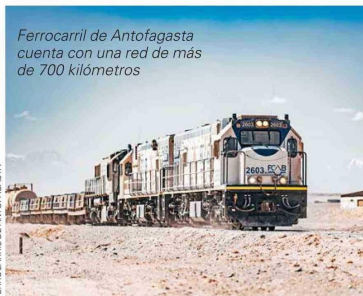
FERROCARRIL DE ANTOFAGASTA