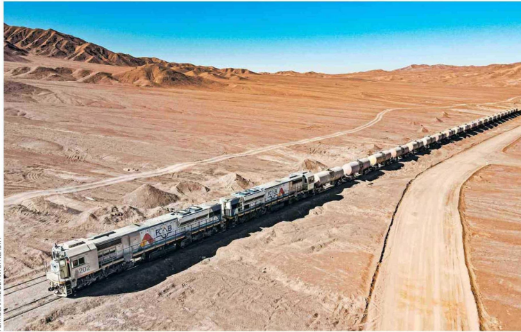
FERROCARRIL DE ANTOFAGASTA

En innovación, FCAB no se ha quedado atrás, pues incorporó la primera locomotora que funciona con hidrógeno verde en Chile y Latinoamérica, un hito que no solo ha mejorado su desempeño, sino que también ha respondido a los desafíos de sostenibilidad de sus clientes.