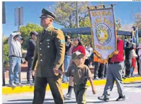
BRIGADAS ESCOLARES REALIZARON JURAMENTO EN LA COMUNA.