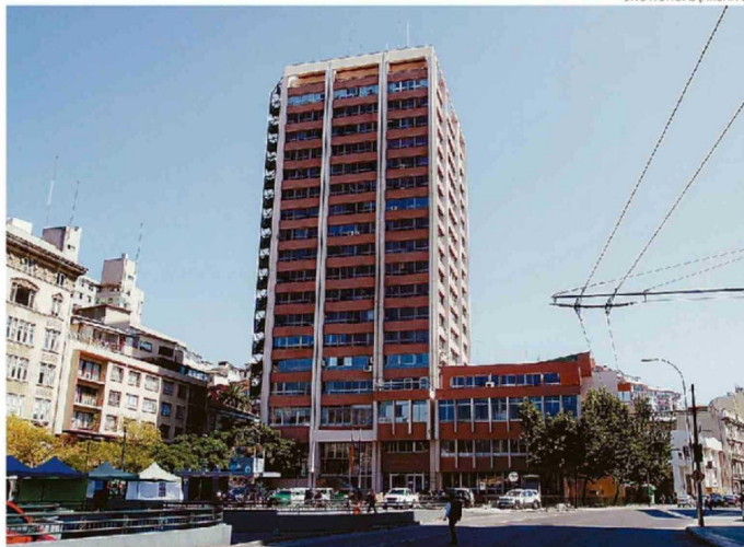
PRESUPUESTO PARA REALIZAR EL ESPERADO ESTUDIO ES DE 180 MILLONES DE PESOS.

"Con fecha 19 de marzo del 2026 se reingresó la licitación para realizar la con-