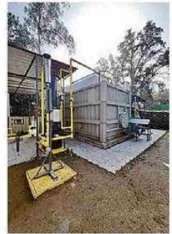
TECNOLOGÍA YA ESTÁ INSTALADA.