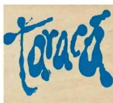
Taracá Jorge Drexler

hace mucho tiempo. Cuando nos intentan enfrentar al género de la canción de autor con el género urbano no tiene ningún sentido; es una discusión tonta. Mucho antes que esto yo tocaba una versión de Ella perrea sola por milonga y me encantaba, pues es una canción maravillosa.