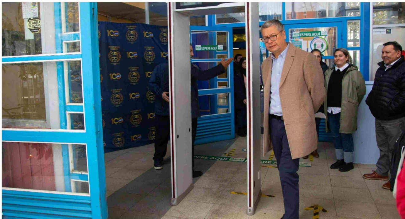
► El alcalde de Temuco Roberto Neira defiende la utilización de detectores de metales en los colegios.

Si bien el ministro de Educación dice que se abre a tener el debate, no ve que sea la respuesta para los hechos que se están viendo en colegios. Pero en paralelo, diversos sostenedores claman por implementar la medida y algunos ya la han empujado, encontrándose con el portazo de la Superintendencia de Educación, que recientemente multó a un recinto por casi 4 millones de pesos.