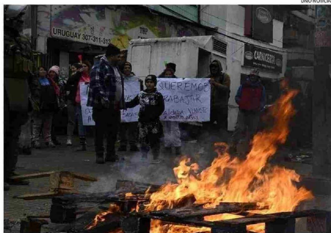
VENDEDORES DE PESCADOS SE MANIFESTARON EN CONTRA DE LA ALCALDESA PUNTUALMENTE.