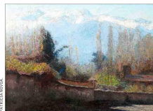
Alrededores de San Felipe, de Alfredo Helsby.