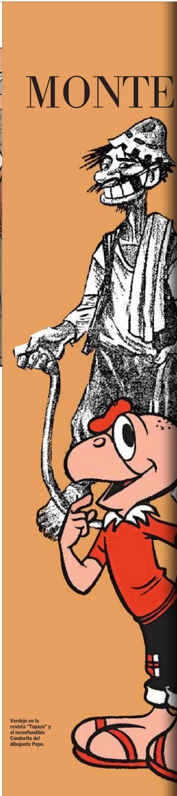
Verdejo en la revista 'Topaze' y el inconfundible Condorito del dibujante Pepo.

10 pinturas de la colección del Banco Central para observar con detención E 6