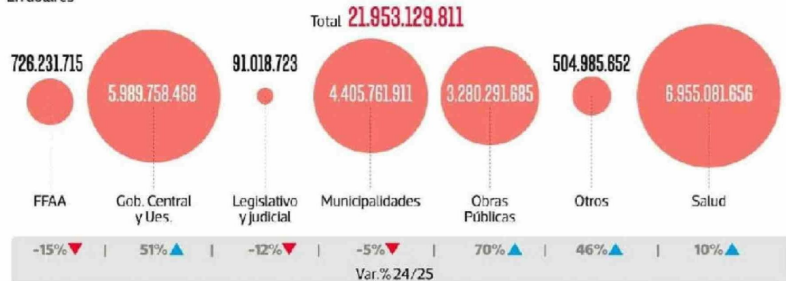
Transacciones por sector En dólares