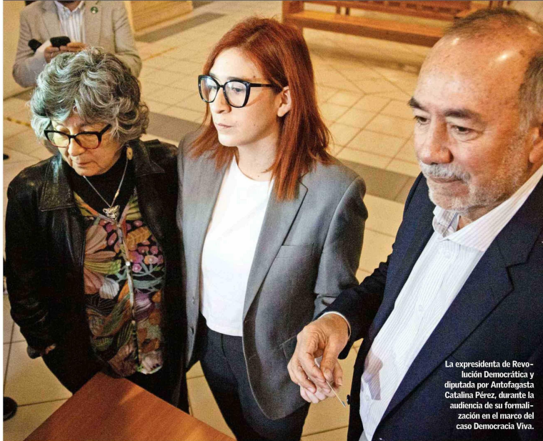
La expresidenta de Revolución Democrática y diputada por Antofagasta Catalina Pérez, durante la audiencia en el marco del caso Democracia Viva.

EN ARRESTO DOMICILIARIO POR CASO QUE INICIÓ LA CRISIS DEL FA: