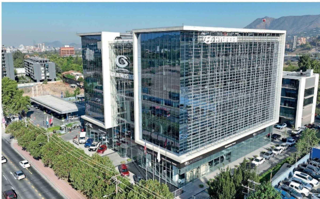
Edificio corporativo de Gildemeister en Las Condes, con oficinas y showroom exclusivo de Hyundai.

También se rediseñaron los servicios para distintos perfiles de clientes,