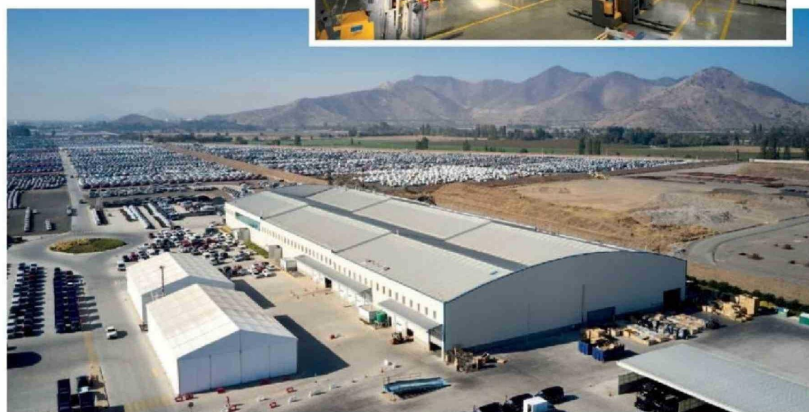
Centro Logístico de Automotores Gildemeister (CLAG) en Lonquén que abarca más de 200.000 m 2 .

y fallas de vehículos eléctricos, la compañía trabaja en un “Centro de Capacitación Postventa”, un espacio de alto estándar teórico y práctico, proyectándose como el centro de formación de postventa más avanzado del país.