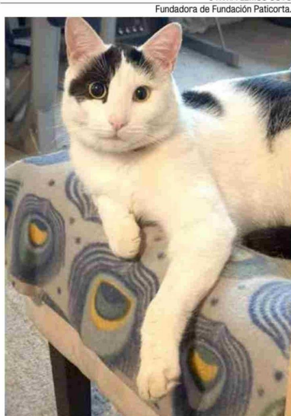
Adoptar a un gatito es una de las mejores experiencias en la vida.

de Tenencia Responsable de Mascotas y Animales de Compañía, más conocida como Ley Cholito, está no ha sido efectiva en la reducción de la población de canes abandonados. Esto porque faltan recursos humanos y económicos y además, no hay fiscalización que permita establecer sanciones a quienes