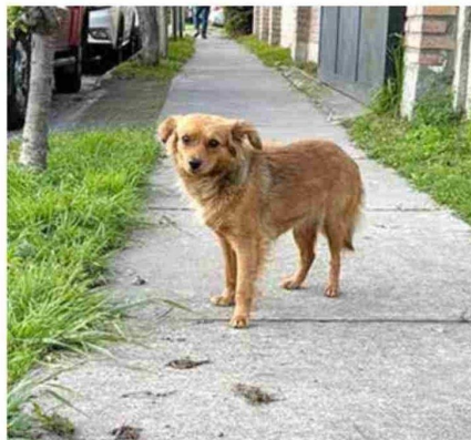
Muchas veces, los canes que se encuentran abandonados son envenenados por vecinos que rechazan su presencia.