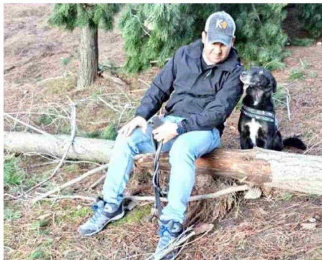
La adopción es la mejor alternativa para cambiar la vida de un perrito abandonado.