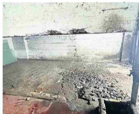
EL SUBSUELO DEL EDIFICIO DE LA QUINTRALA, EN CALLE ESTADO.