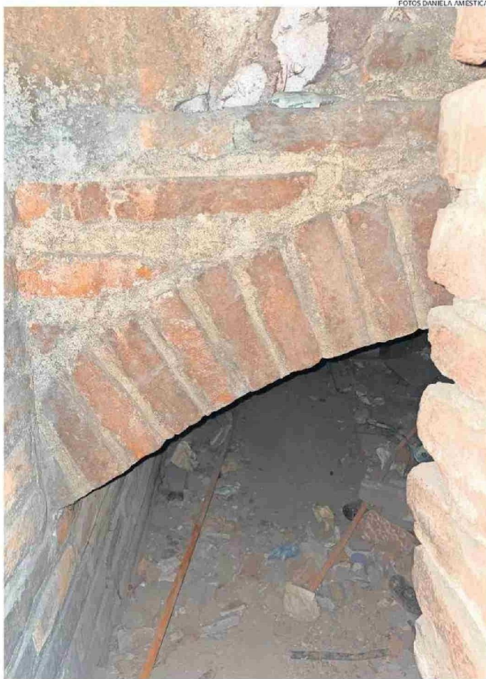
TÚNEL BAJO UN EDIFICIO DE SANTIAGO, EL PRIMERO QUE VISITÓ LA AUTORA.

La autora así llega al ex Congreso, donde antes estuvo la Iglesia de la Compañía de Jesús, que a mediados del siglo