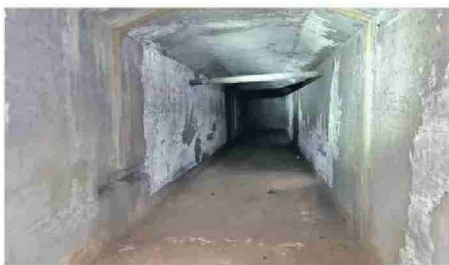
EL EX CONGRESO ANTES FUE UNA IGLESIA JESUITA.

XIX sufrió un incendio donde fallecieron más de 2.000 personas. En clave de novela, la